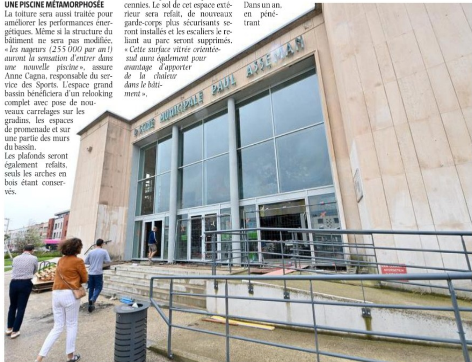
De grandes baies vitrées ont été installées sur la façade.