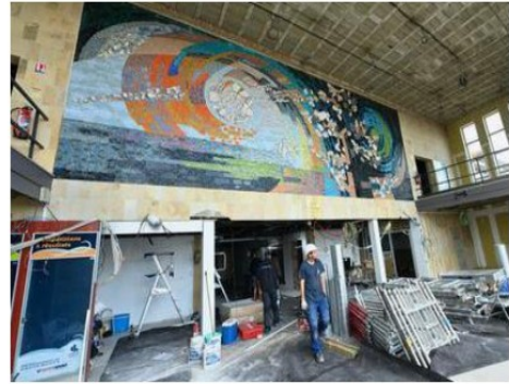
L'espace accueil sera réorganisé.