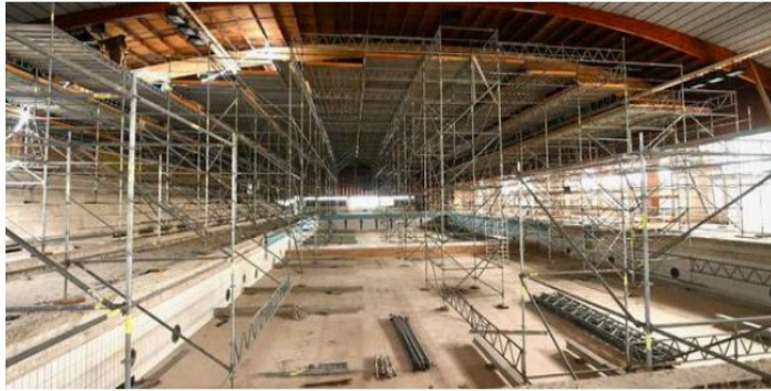
Un impressionnant échafaudage a été installé dans le grand bassin.